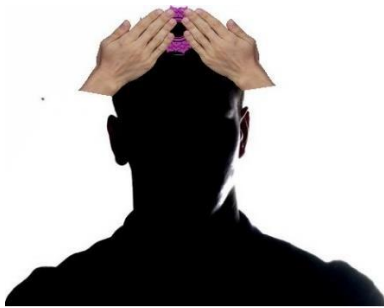
Posición en el Chakra Corona