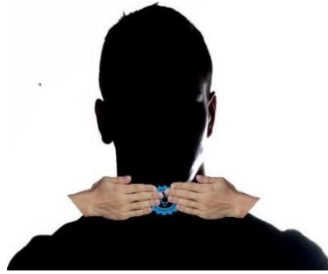
Posición Chakra Garganta