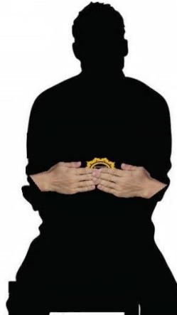
Chakra del Plaxosolar