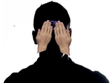
Posición en Chakra 3° Ojo