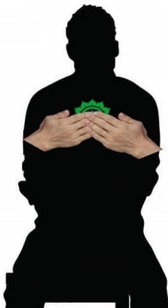
Chakra del Corazón